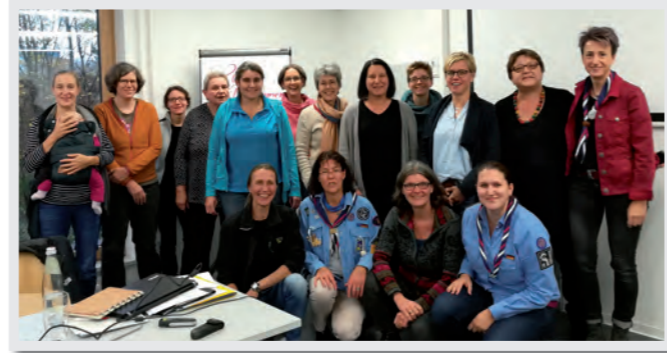
Kuratorium, Vorstandsfrauen und Gäste im November 2018

Wir Vorstandsfrauen freuen uns, dass viele „alte Hasen“ uns treu bleiben. Euer Vertrauen, eure Ideen und eure kritischen Fragen bedeuten uns sehr viel. Denjenigen, die ihre Zeit und Energie künftig anderen Themen und/oder Menschen in ihrem Leben widmen möchten, sagen wir herzlichst danke für all die wertvollen Beiträge, mit denen sie uns in den vergangenen Jahren begleitet haben. Und diejenigen, die sich neu in unseren Kreis haben berufen lassen, heißen wir herzlich willkommen. Wir freuen uns auf eure Erfahrungen und Sichtweisen.